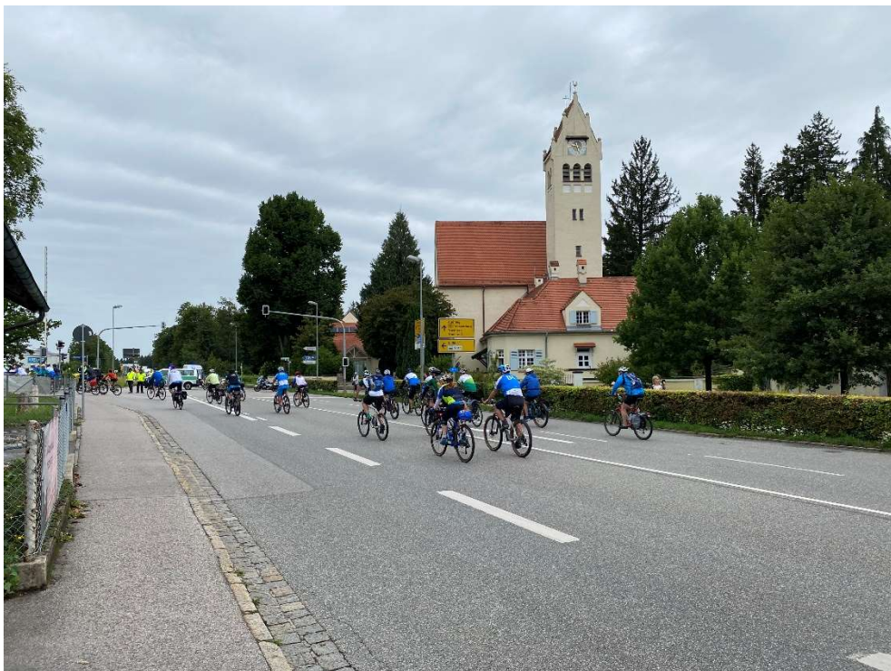
1.600 Radler passieren uns in einem 20 Minuten dauernden Corso.