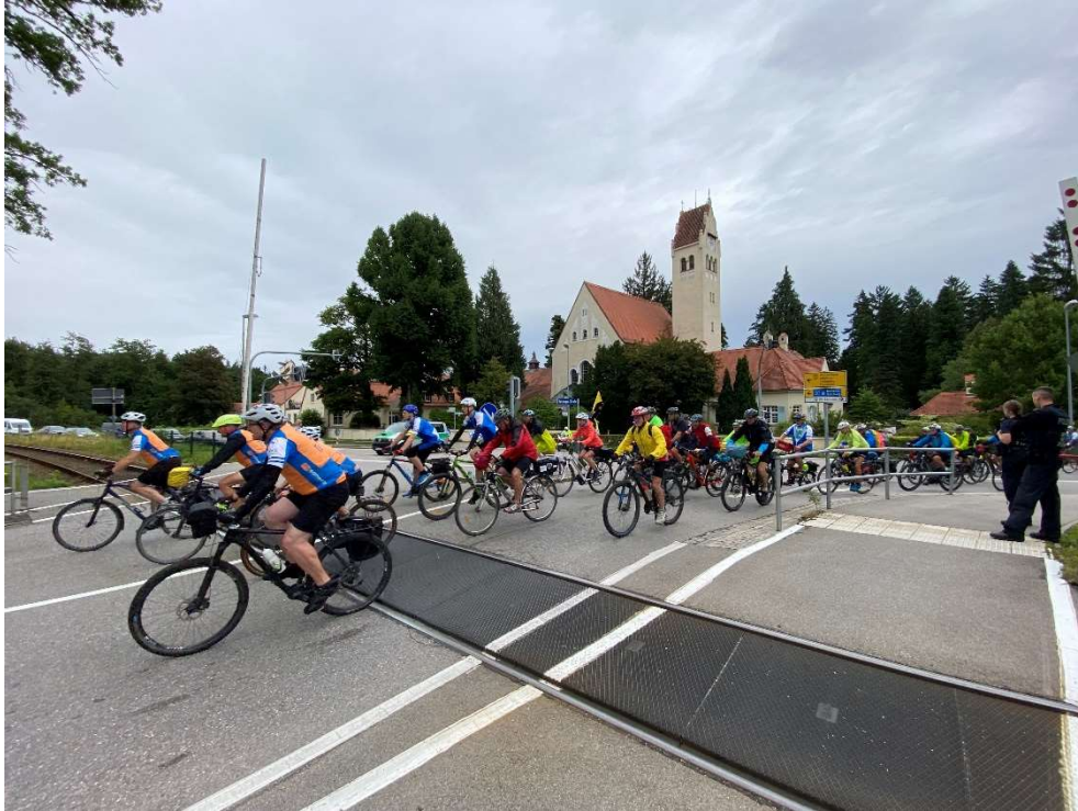
An der Feuerbestattung vorbei geht's nach links zum Chiemsee.